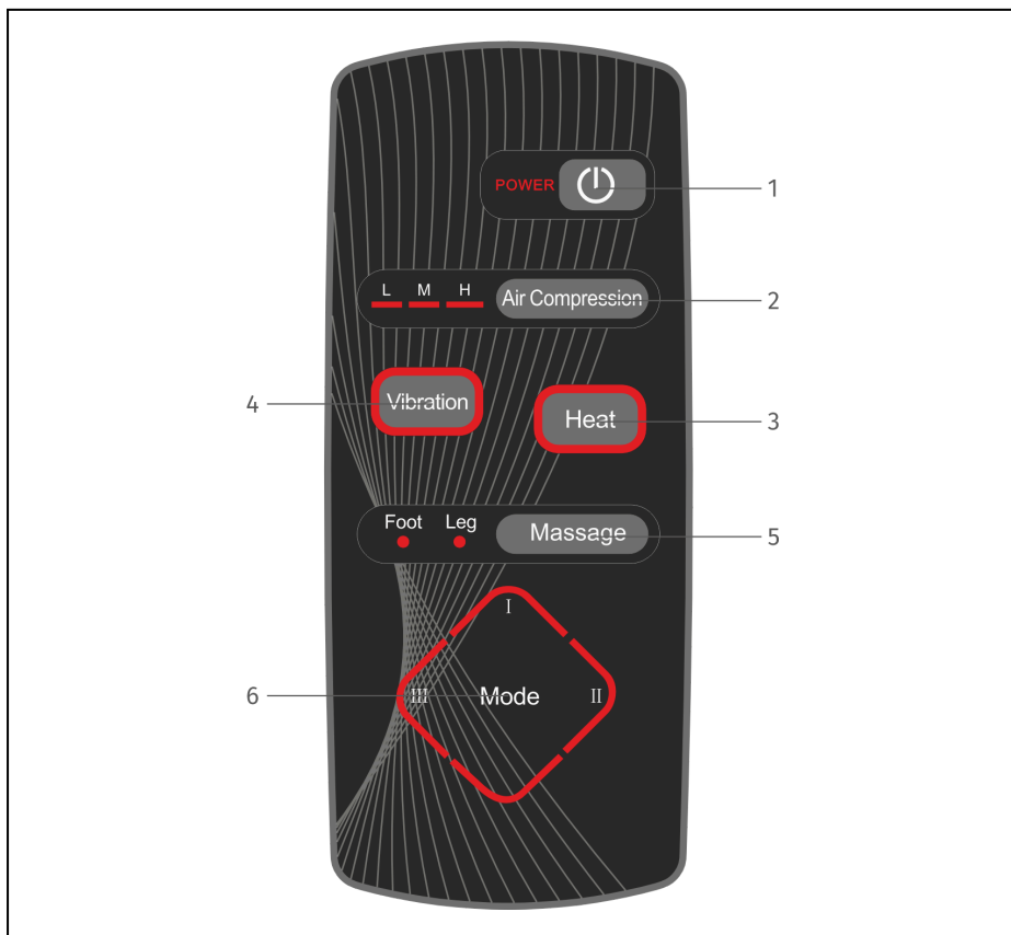
Рисунок 2 — Панель управления