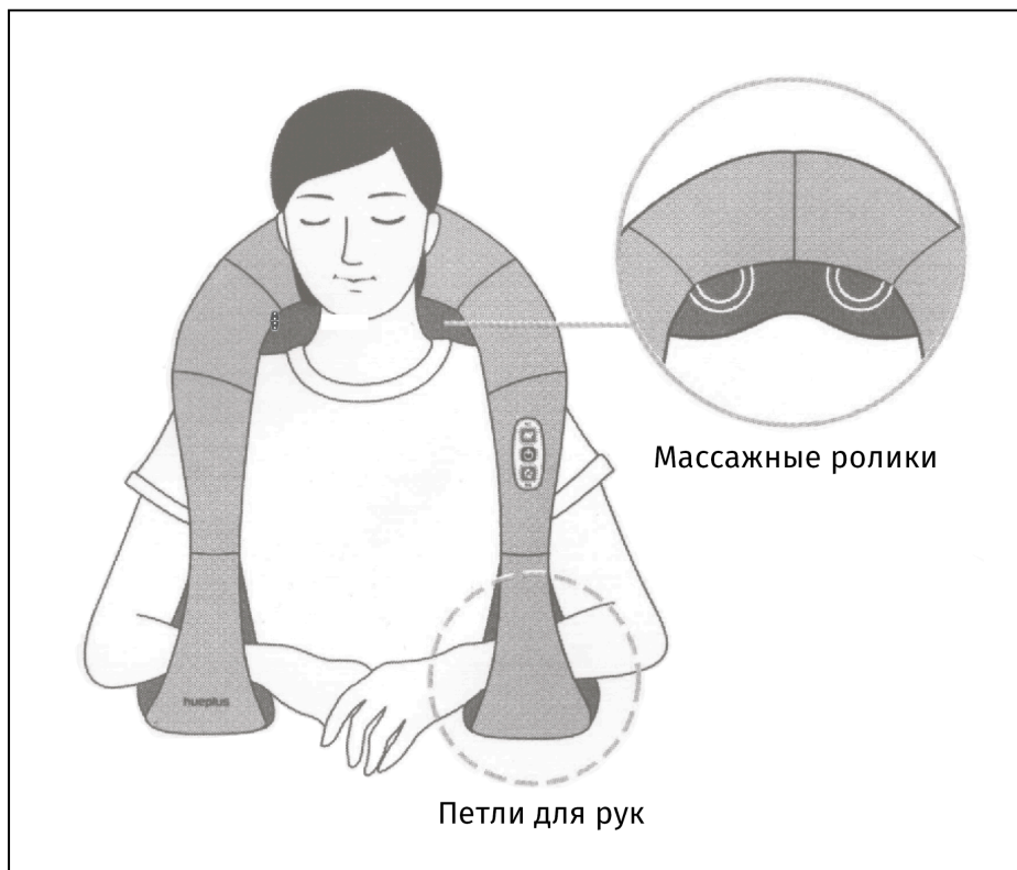
Рисунок 3 — Устройство массажера