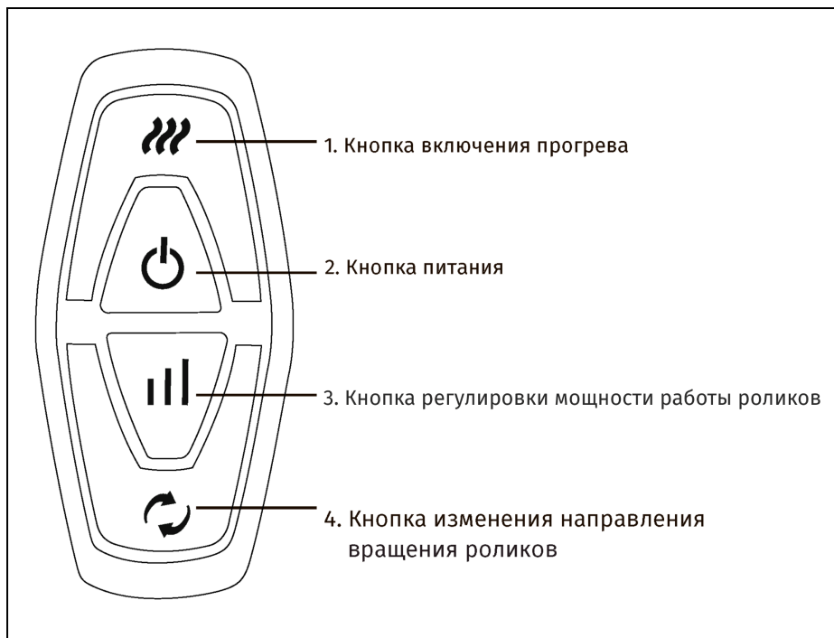
Рисунок 2 — Управление